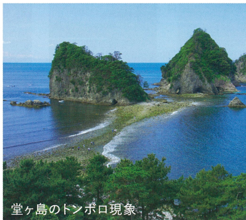
堂ヶ島のトンボロ現象